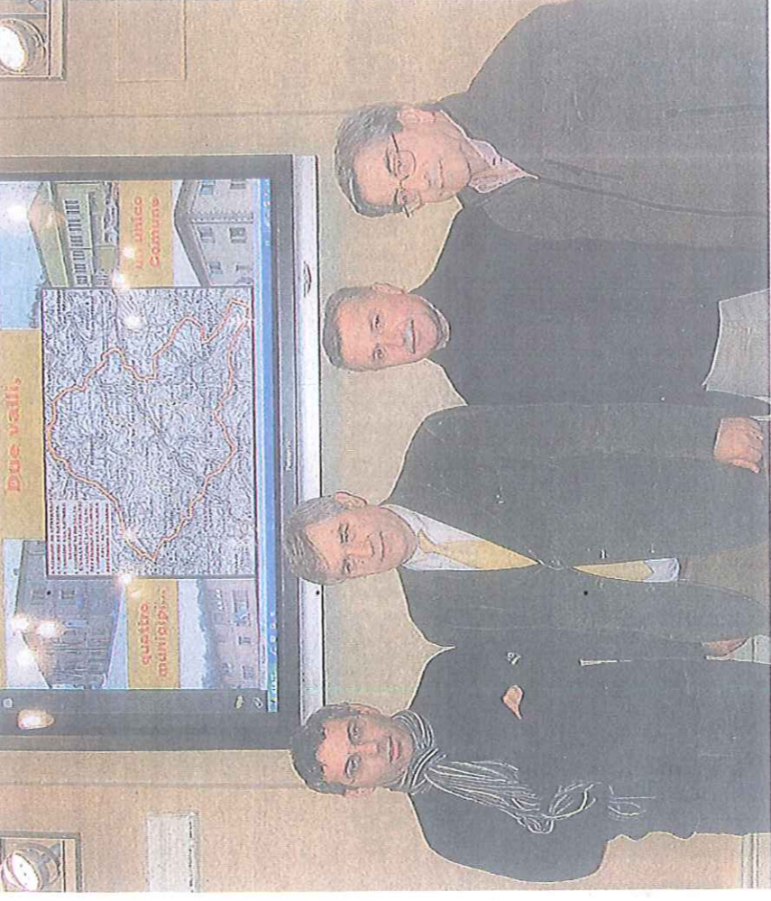
I quattro sindaci e, alle loro spalle, la mappa del territorio

blee dove sono state ricevuti incoraggiamenti e ovviamente anche raccolto critiche». Tuttavia, nel complesso, i primi cittadini sono usciti da queste assemblee con la «convincenza rafforzata» che quella della fusione fosse la strada giusta.